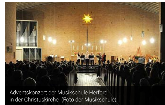
Adventskonzert der Musikschule Herford in der Christuskirche