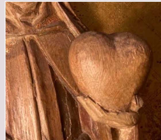
Brigitta zeigt Herz · Detail des Schnitzaltares im Nordschiff der Marienkirche