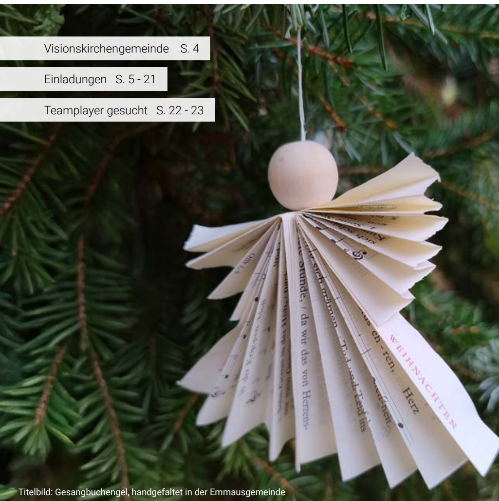
Titelbild: Gesangbuchengel, handgefaltet in der Emmausgemeinde